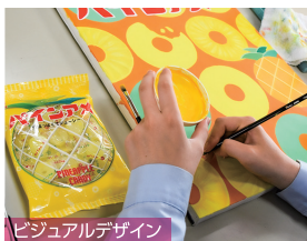
ビジュアルデザイン